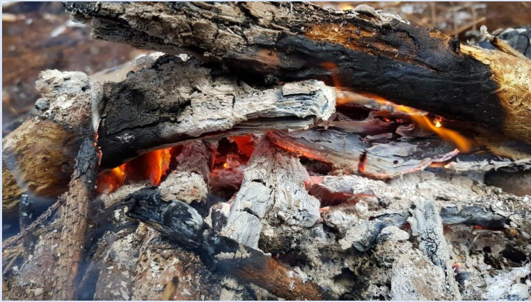
Die warme Glut tut gut im eisigen Winterwald!