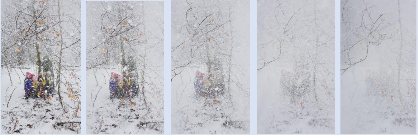
Mitten im Schneesturm!!