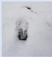
Dachs- und Rehspuren, was da nachts wohl los war?