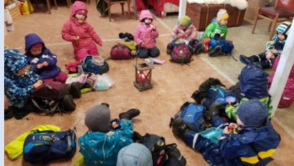
Znüni in der Hütte, gemütlich und warm