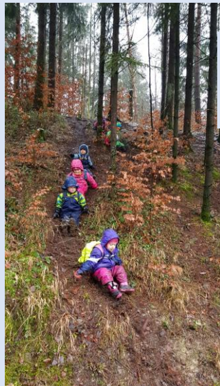
Erst noch auf dem Trockenen und dann: juhui, das fäget!!